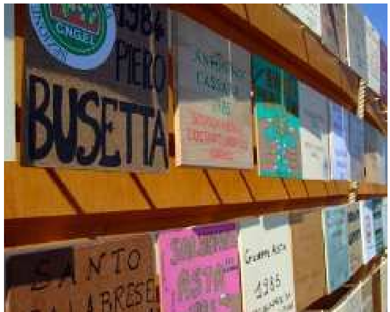
I lavori realizzati per il 21 marzo di Bari

Per informazioni: educazionelegalita@libera.it, campania.21marzo@libera.it oppure telefonare a 0817968801 - 0817968732 - 0817968734