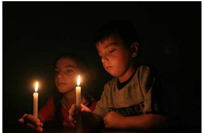
Tavola della Pace, Coordinamento Nazionale Enti Locali per la pace e i diritti umani, Acli, Arci, Agesci, Articolo 21, Cgil, Pax Christi, Libera. Associazioni Nomi e Numeri contro le mafie, Legambiente, Associazione delle Ong italiane, Beati i Costruttori di pace, Emmaus Italia, CNCA, Gruppo Abele, Cipsi, Banca Etica, Volontari nel Mondo Focsiv, Centro per la pace Forlì/Cesena, Lega per i diritti e la liberazione dei popoli (prime adesioni, 6 gennaio 2009)